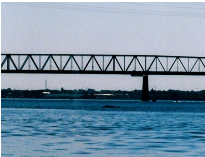
Finhval i Lillebælt sept. 2003

+Vore+hvaler sættes i national og international kontekst dvs. de indre danske farvande, Østersøen og Nordøst Atlanten.